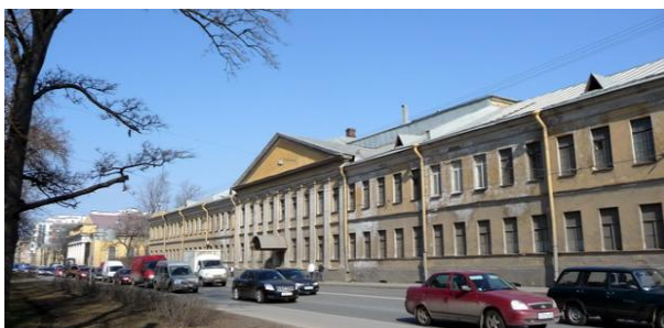
ул. Ждановская, дом 13